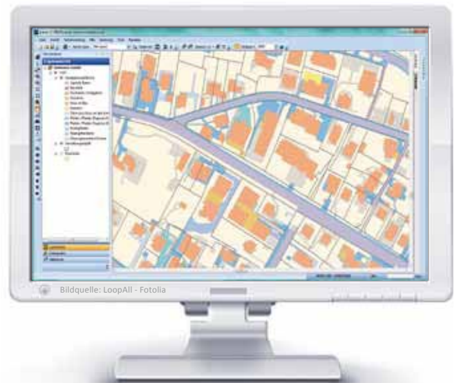
Abb.: Einblick in die Applikation Getrennte Gebühr

Führen Sie für die Bearbeitung notwendige Informationen aus unterschiedlichsten Datenquellen zusammen und lassen Sie sich von unserer Applikation Getrennte Gebühr bei Ihrer Arbeit unterstützen.